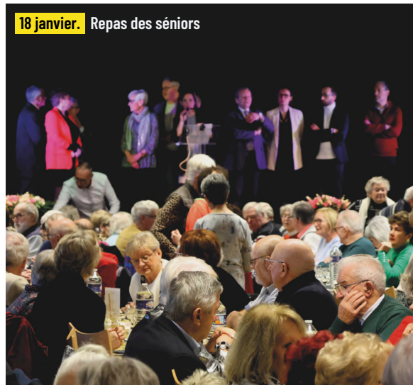
18 janvier. Repas des séniors