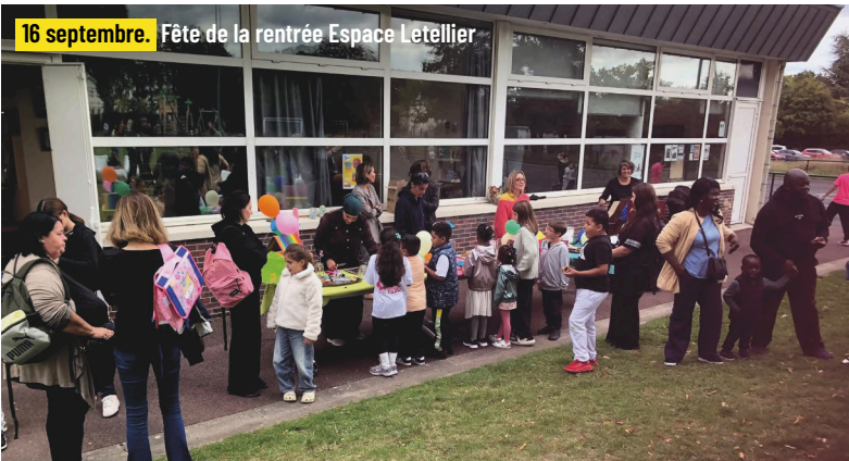
16 septembre. Fête de la rentrée Espace Letellier