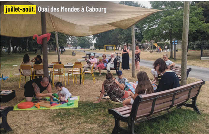
juillet-août. Quai des Mondes à Cabourg