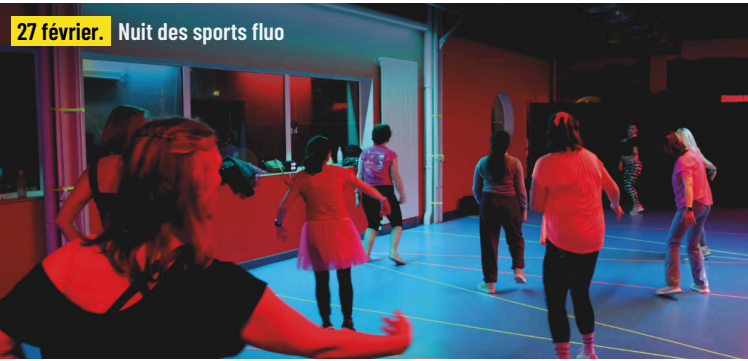
27 février. Nuit des sports fluo