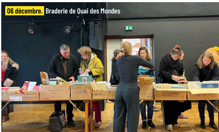
06 décembre. Braderie de Quai des Mondes