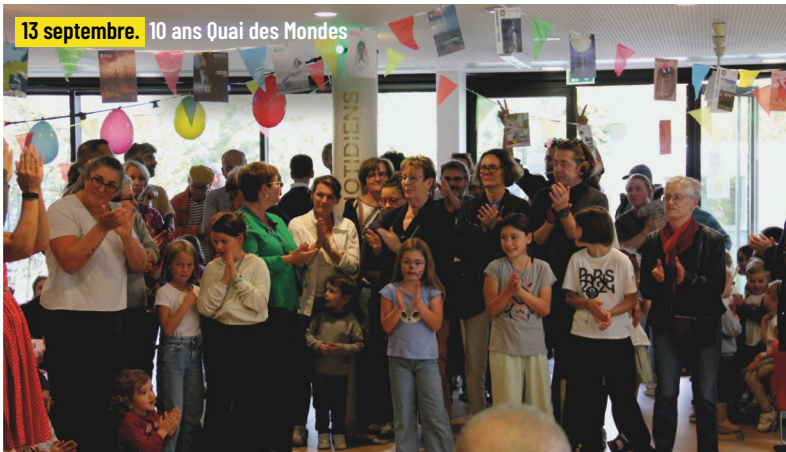
13 septembre. 10 ans Quai des Mondes