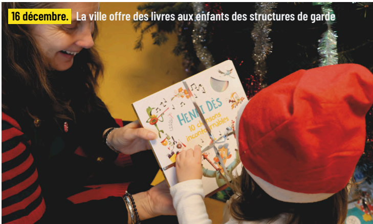
16 décembre. La ville offre des livres aux enfants des structures de garde