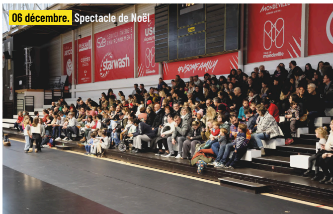
06 décembre. Spectacle de Noël