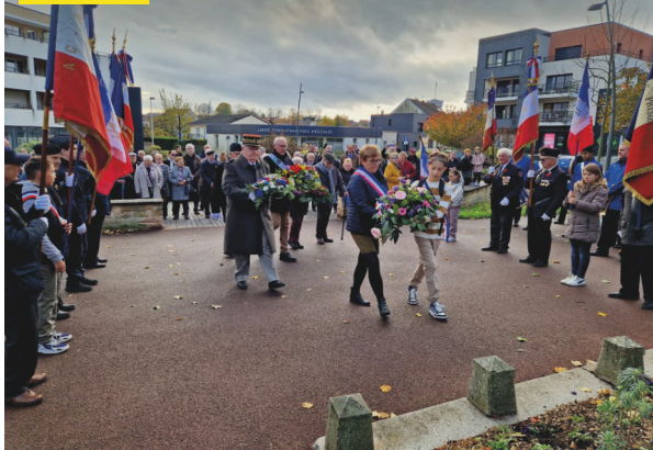
11 novembre. Commémoration 11 novembre