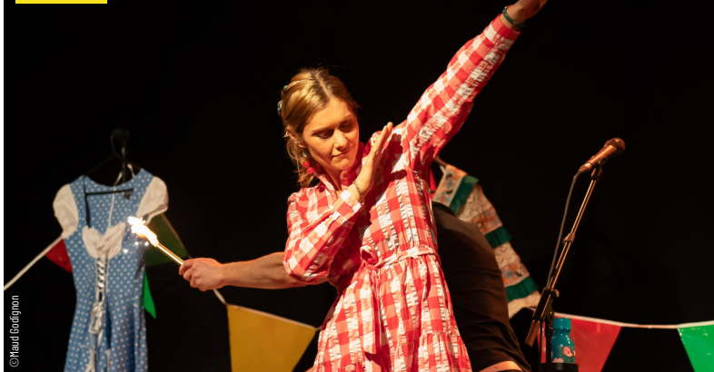
novembre. Mondeville sur rire - NOV - Giedre