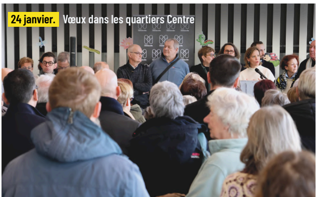
24 janvier. Vœux dans les quartiers Centre