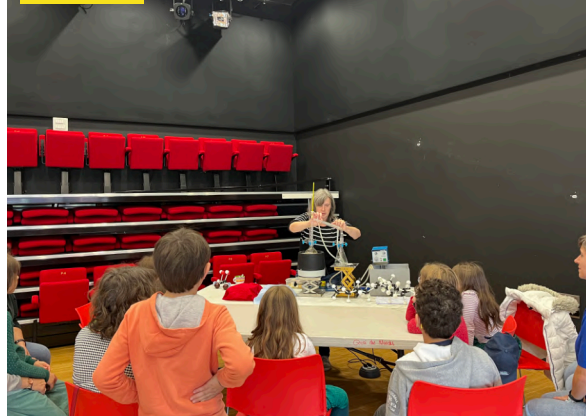
10 octobre. Fête de la science