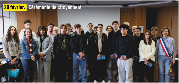
28 février. Cérémonie de citoyenneté