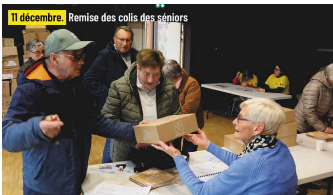
11 décembre. Remise des colis des séniors