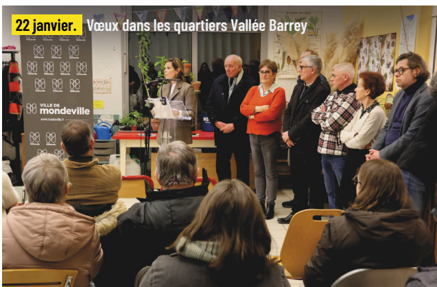
22 janvier. Vœux dans les quartiers Vallée Barrey