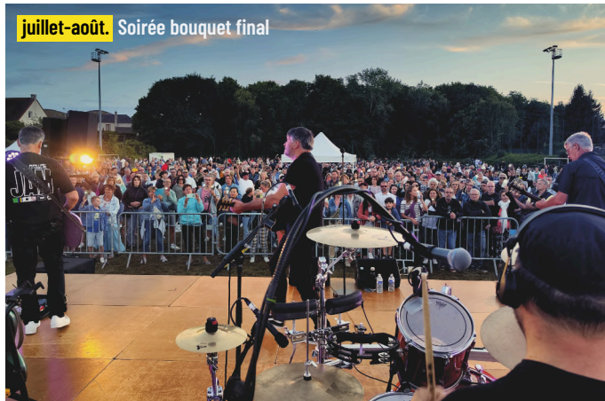
juillet-août. Soirée bouquet final