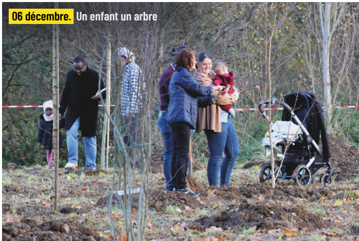
06 décembre. Un enfant un arbre