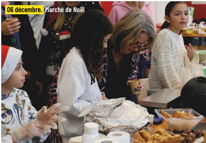
06 décembre. Marché de Noël