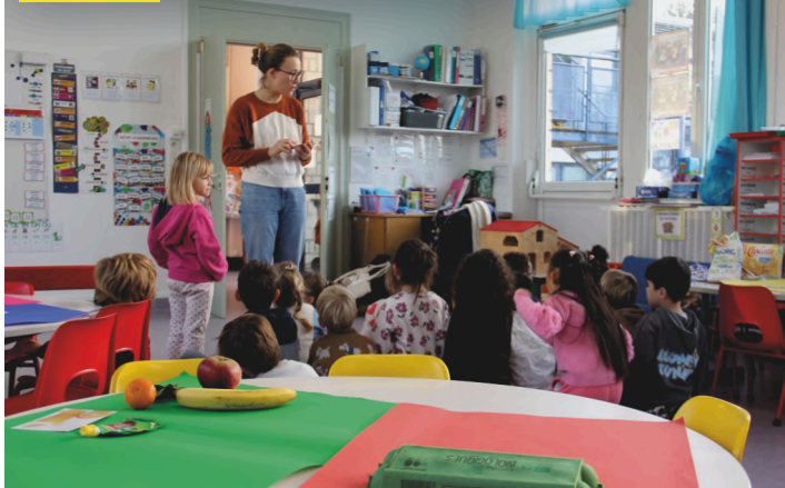
24 novembre. Atelier bien manger dans les écoles