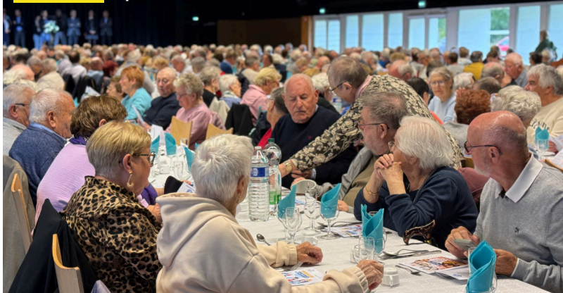
05 octobre. Repas des seniors