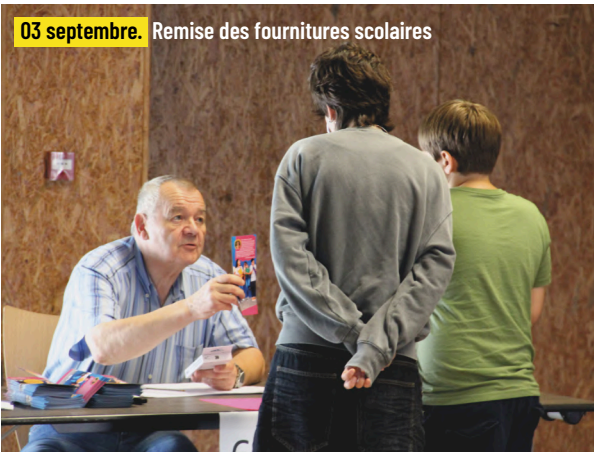
03 septembre. Remise des fournitures scolaires