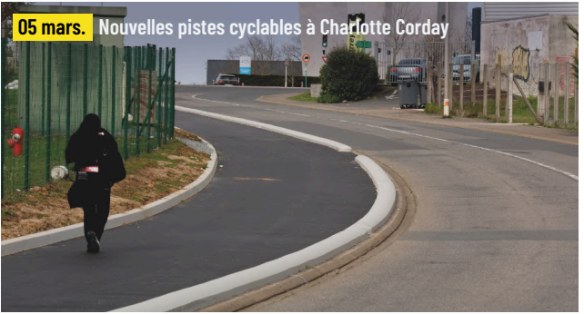
05 mars. Nouvelles pistes cyclables à Charlotte Corday