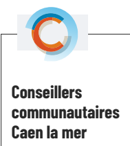
Conseillers communautaires Caen la mer