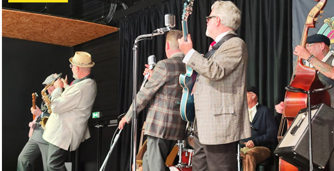
13 octobre. La semaine bleue