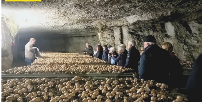
16 octobre. Visite à la champignonnière d'Orbec