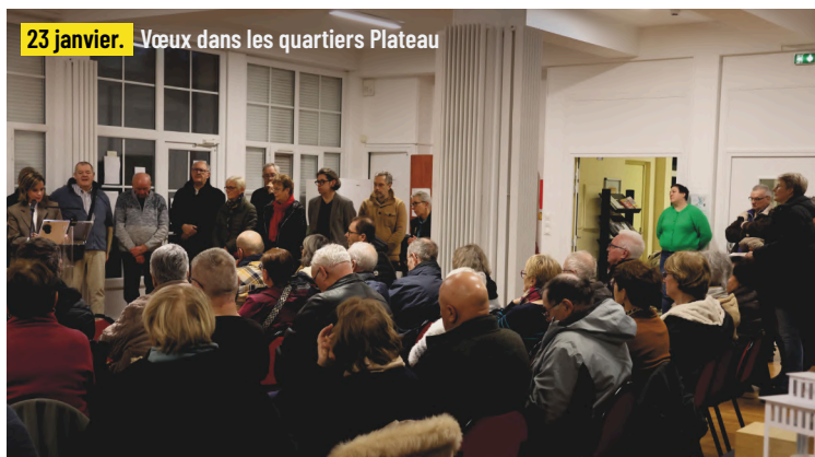
23 janvier. Vœux dans les quartiers Plateau