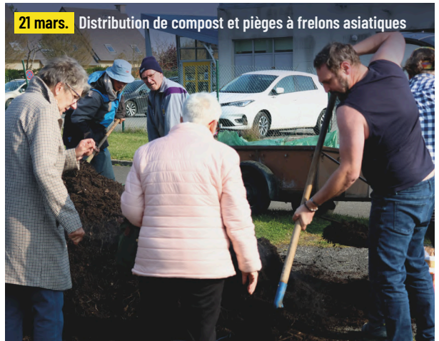
21 mars. Distribution de compost et pièges à frelons asiatiques