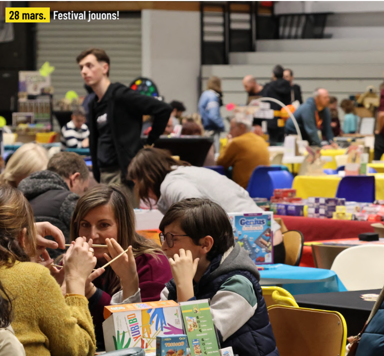
28 mars. Festival jouons!