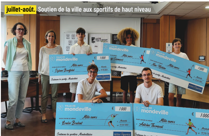
juillet-août. Soutien de la ville aux sportifs de haut niveau