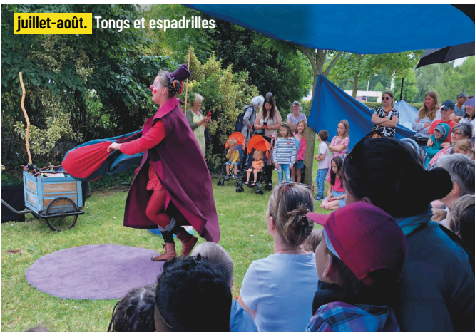
juillet-août. Tonges et espadrilles