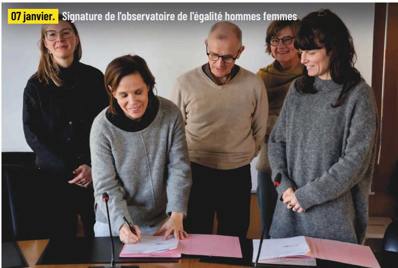
07 janvier. Signature de l'observatoire de l'égalité hommes femmes