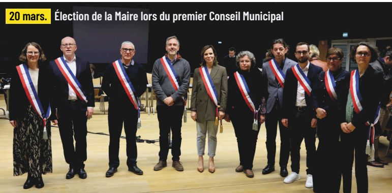
20 mars. Élection de la Maire lors du premier Conseil Municipal