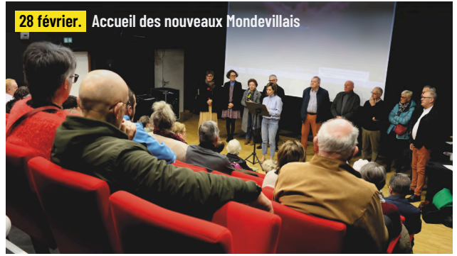
28 février. Accueil des nouveaux Mondevilais