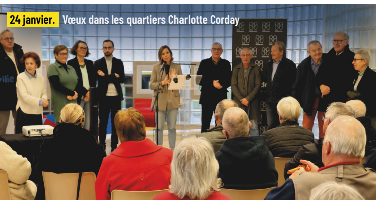
24 janvier. Vœux dans les quartiers Charlotte Corday