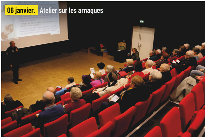
06 janvier. Atelier sur les arnaques